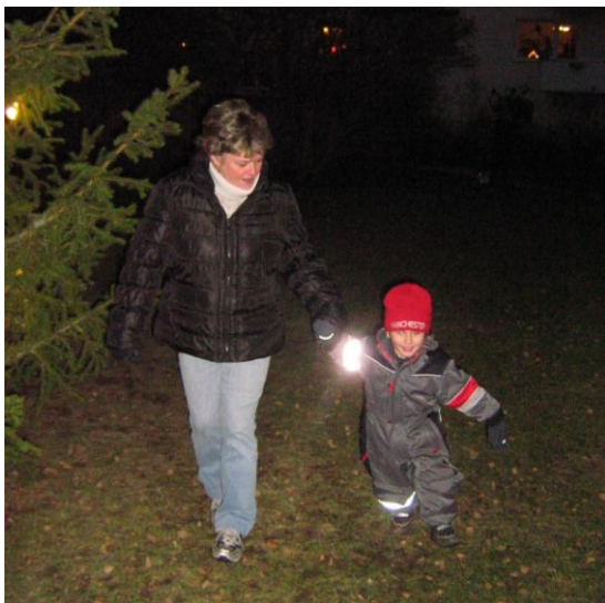
Dansen går ...