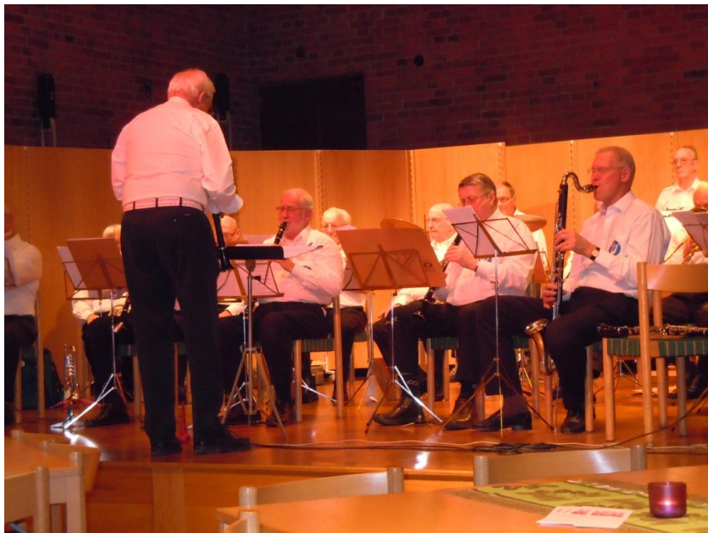
Enskede-pojkarna i full aktion

Efter önskemål från många medlemmar samlades vi åter i Söderledskyrkan där Enskede-pojkarna underhöll och skapade en trevlig inramning, samtidigt som det bjöds på kaffe och smörgås.