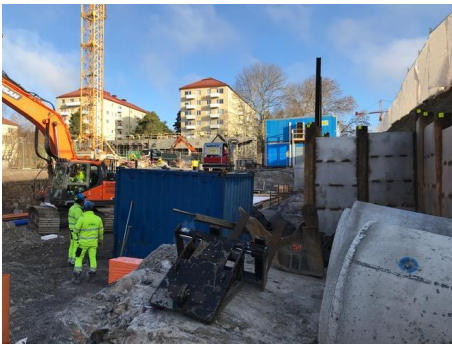
Vy från Majrovägen ...

Medlemsbladet kan konstatera att det är byggen som alltså berör och engagerar. En del tycker att det byggs för mycket och andra tycker att det är bra att det byggs.