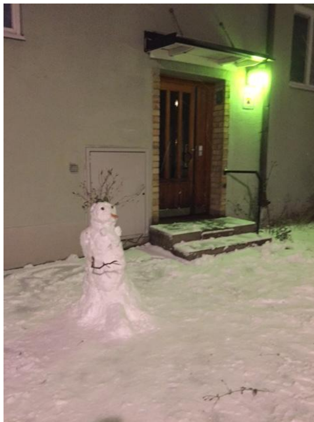
men glatt leende i profil

Den 16 januari ställde sig 2018 års första snögubbe på vakt utanför entréporten Bordsvägen 64