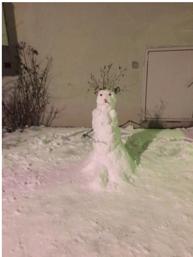
Något okammad frisy