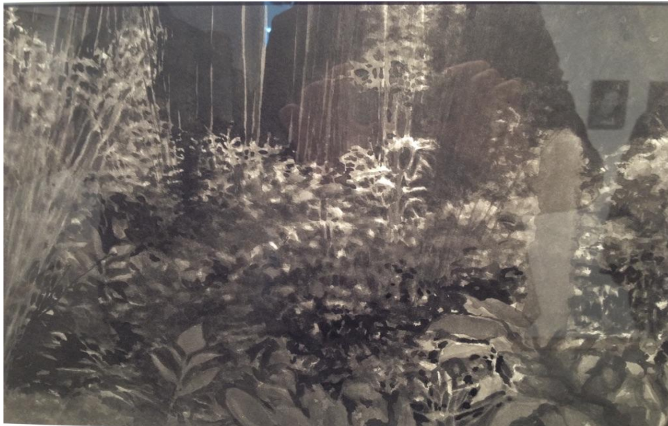
”Magic Garden” i tusch på papper.