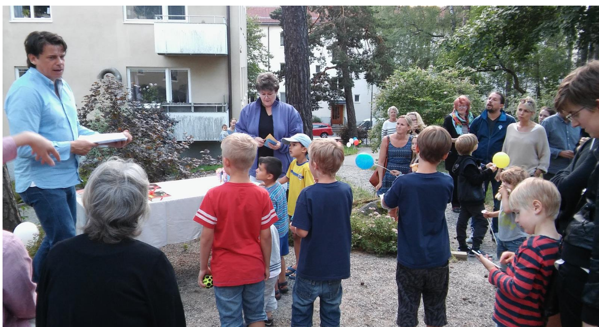
Förväntansfulla deltagare inför prisutdelningen på Sagoberget

Ett stort prisbord gjorde sedan att alla de yngre deltagarna kunde få med sig ett litet pris hem efter den spännande upptäcktsfärden i sagornas värld och några vuxna fick med sig nya "deckarupplevelser" i form av böcker.