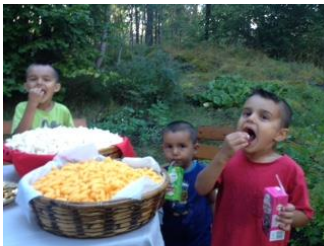
Åååh va' gott med PopCorn och Ostbågar ...

Priser delades ut till de många duktiga mjölkämparna som kom med sina hittade Sk'dunker.