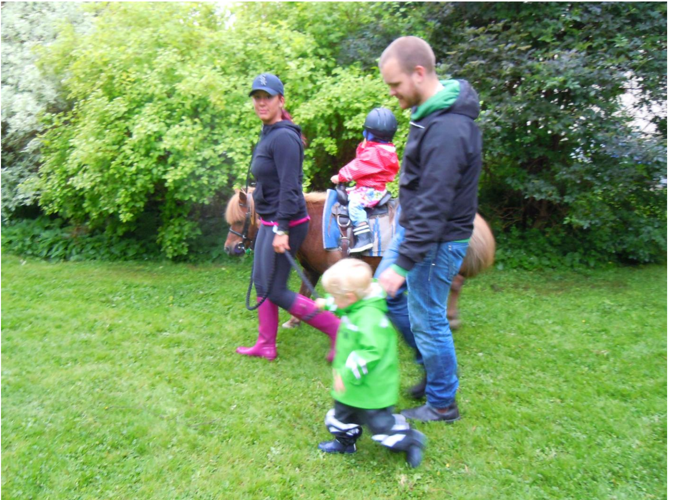
Idel glada miner och ponnyn DUMLE travade på med ny last hela tiden (kön var låååång)