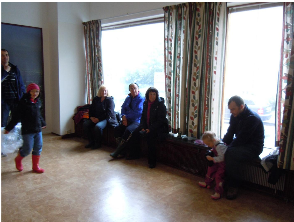
Välförtjänt vila och värme ...