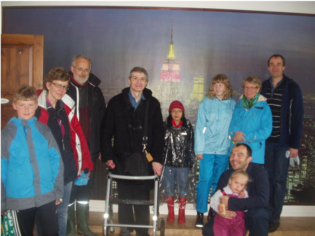
Några av deltagarna vid tipspromenaden inne i affärslokalen i hörnet av Knektvägen/Bordsvägen (fd Wimans). Utanför skyltfönstret driver isiga vindar fram. En oförglömlig föreningsdag i juni 2012.