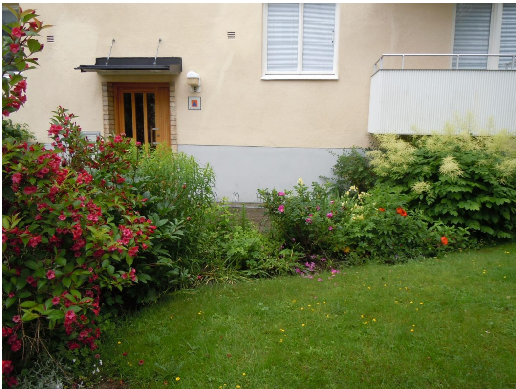
En av föreningens välvårdade trädgårdar