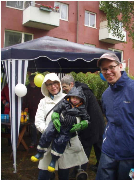
Familjen Alm framför det hela partytältet