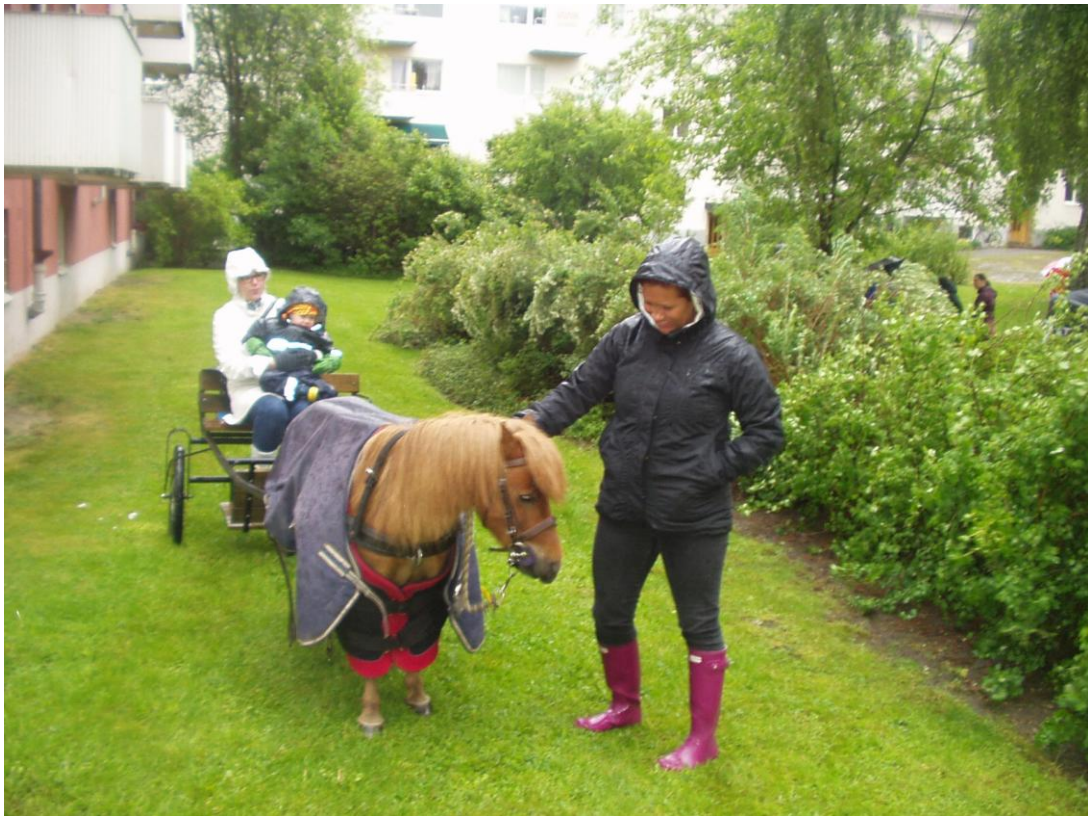
När ponny-hästarna fick på sig vinterkostymen tyckte de också att det var okej att delta i festen.