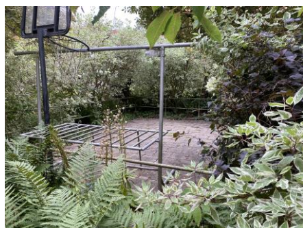
Pisk-ställningen i Kamelparken

När höghuset byggdes i slutet på 1940-talet så kan Medlemsbladet berätta att det fanns två speciella piskbalkonger högst upp som öppningar i taket, med en vidunderlig utsikt. Två stycken fanns även i toppen på det andra höghuset. Idag är det alla överbyggda med tak och hyrs ut som förråd. Ännu kan spåren skönjas i att takpannorna inte är lika slitna på den plats där de tidigare fanns piskbalkonger.