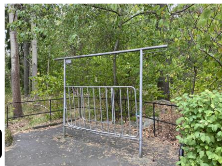
Pisk-ställningen vid Bordsvägen 54-56

Visst var det förstås vanligare att höra rottingens klassiska slag i föreningens tidigare decennier men än i dag genljuder kvarteren av dessa klassiska ljud. Så våra pisk-ställningar är både historiska detaljer ur folkhemmets tidiga år och samtidigt praktiska delar av vår förening i dag.