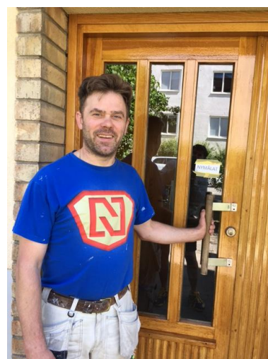
Renovering av alla våra portar fortsätter ...