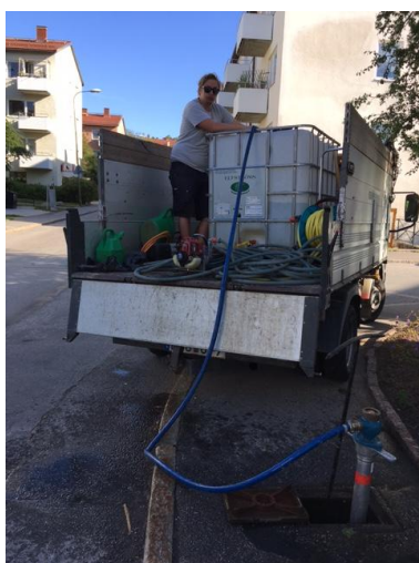
Krattning, rensning och påfyllning av vatten sker kontinuerligt i våra trädgårdar ...

Hör av Dig till SBC – 0771-722 722 om intresse finns.