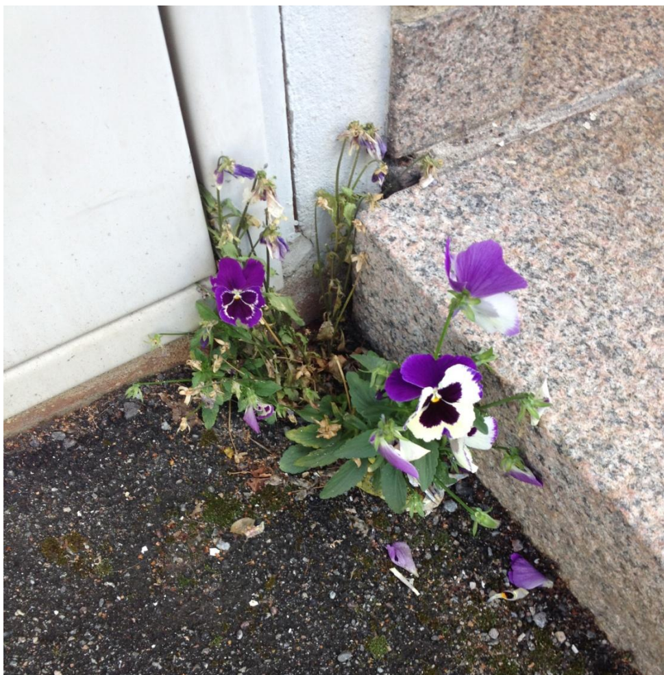
Fotot är taget på Bordsvägen 49